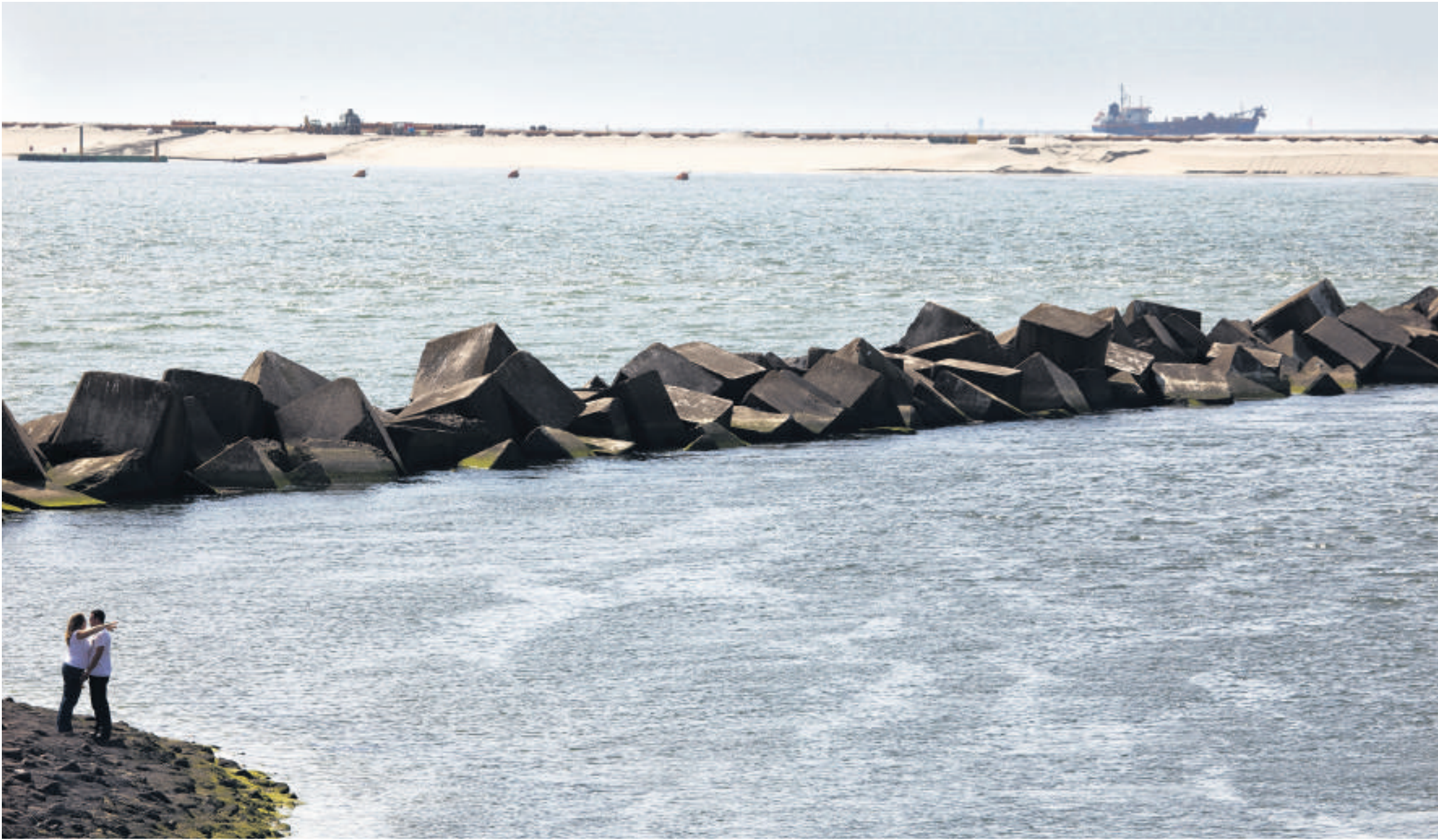
De Tweede Maasvlakte in wording.

op de Maori's geschoten', aldus een medewerker van het Rotterdamse gemeentearchief. Alle voorstellen werden van tafel geveegd, en het Havenbedrijf werd gevraagd mee te denken. Afgelopen april onthulde koningin Beatrix de namen van de nieuwe havens: Amalia, Ariane en Alexia naar haar kleinkinderen en Margriet naar haar zus. De laatste naam is trouwens een kleine goedmaker van het Havenbedrijf tegenover de koninklijke familie. In de Eemhaven was al een haven naar Margriet vernoemd, maar die werd zeven jaar geleden gedempt om meer ruimte te maken voor containeroverslag.