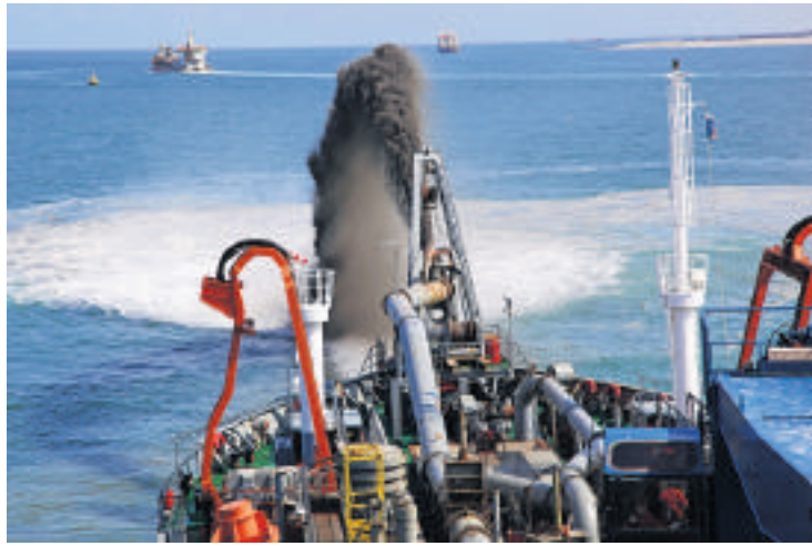
Sleepopperzuiger in actie voor de kust van Hoek van Holland.

Alles bij elkaar gaat het om een oppervlakte-uitbreiding van de bestaande haven met 20 procent. De capaciteit voor containeroverslag